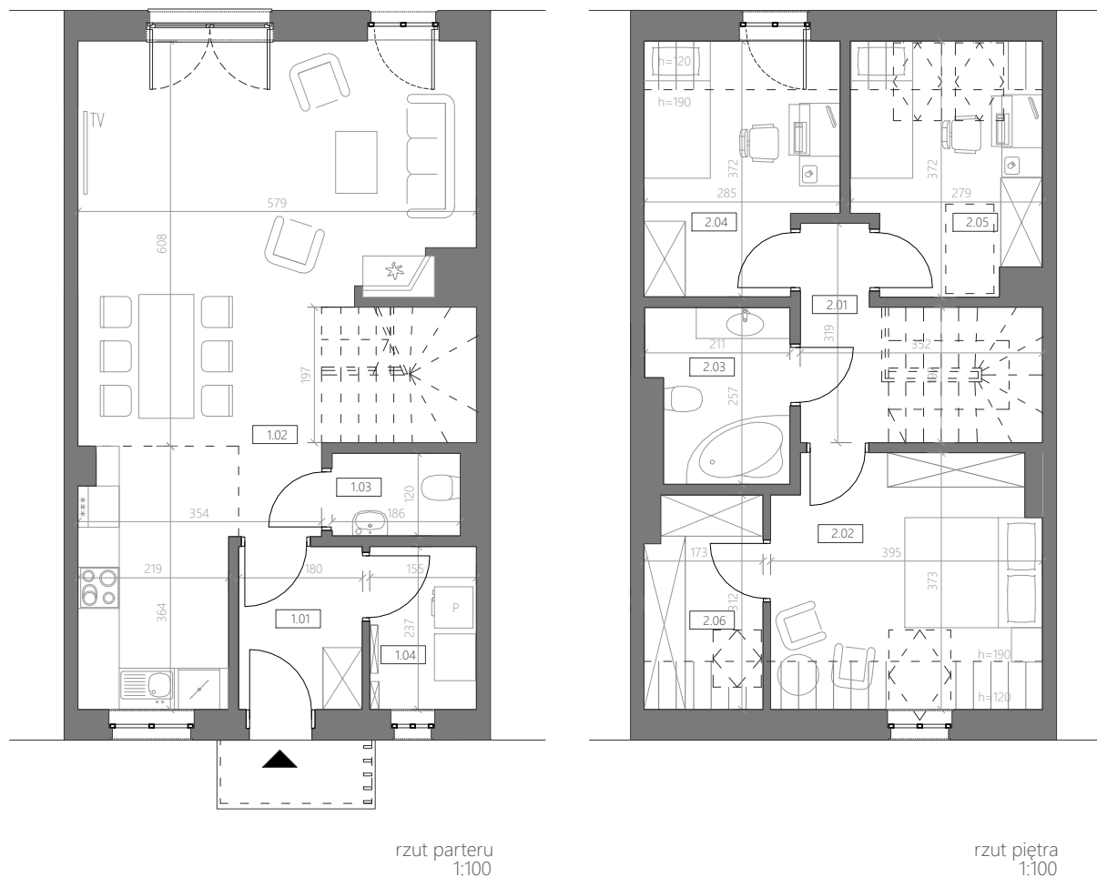
rzut parteru 1:100